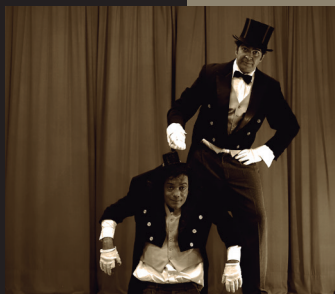
E Tudo A Magia Levou