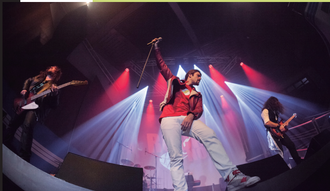
One Vision | Tributo a Queen