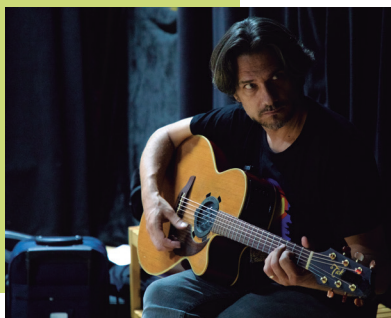
"Palhinhas A História De Um Espantalho"