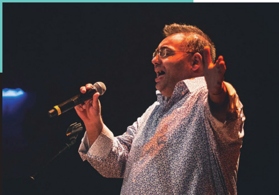
Diego El Gavi