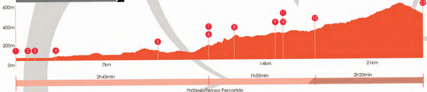
gráfico de altimetria altura/distância