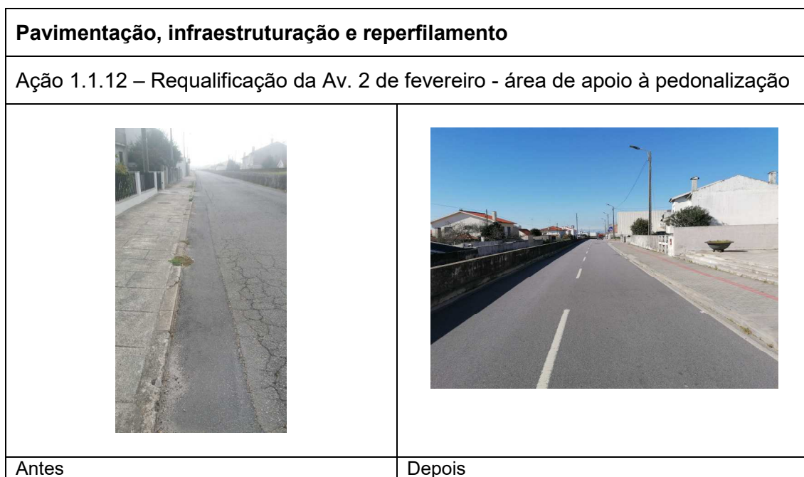
Tabela 3 - Levantamento fotográfico das ações executadas.

A seguir, são destacadas as transformações de algumas ações realizadas, segundo previsto e calendarizado no PERU.