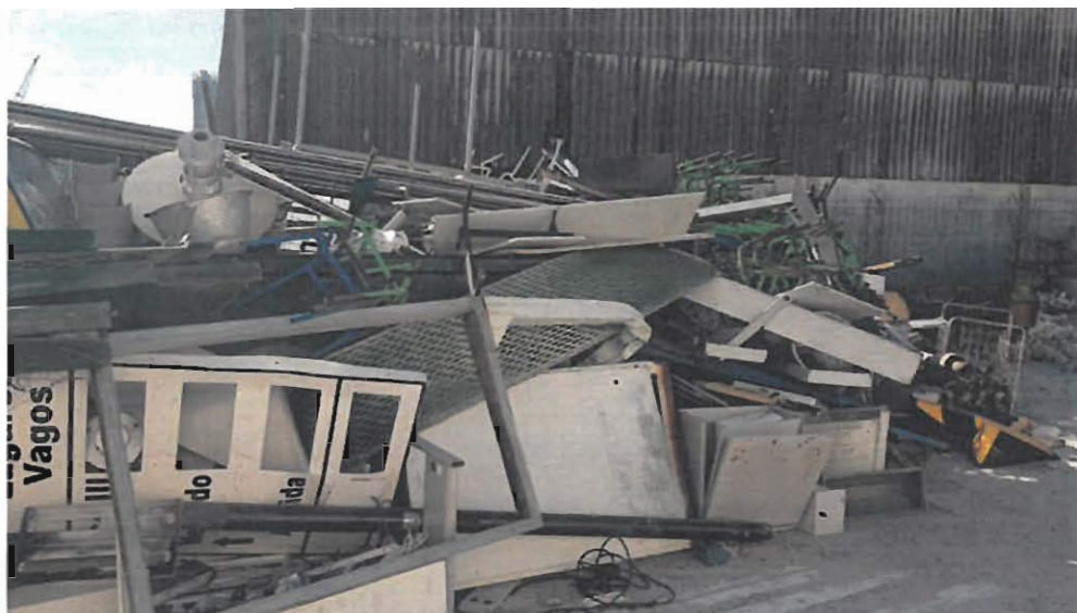
Lote 1 – Sucata diversa de metal