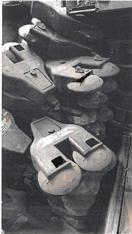
Lote 3 – Sucata de caixas metálicas de antigos parcometros