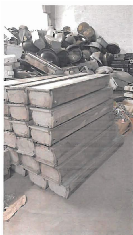
Lote 2 – Sucata diversa de material eléctrico