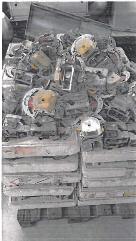
Lote 4 – Sucata de relógios de antigos parcometros