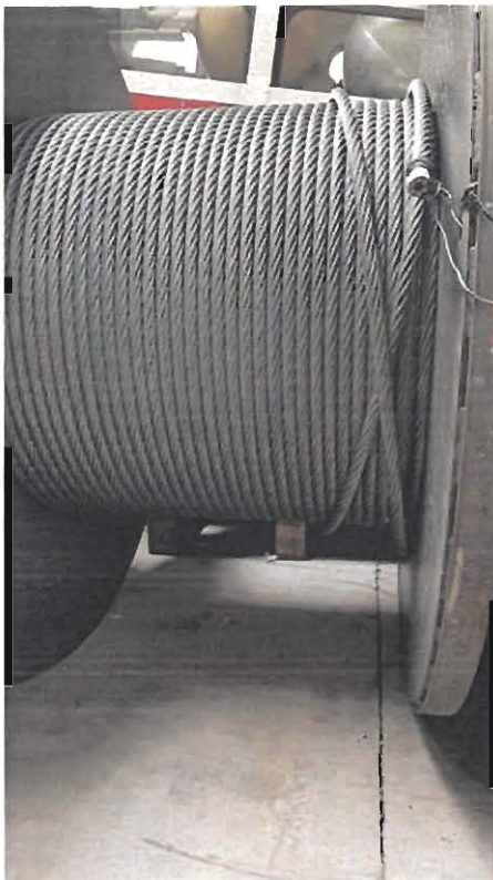
Lote 5 – Sucata de cabo de aço