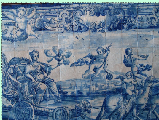
Museu de Artes Decorativas - CMVC