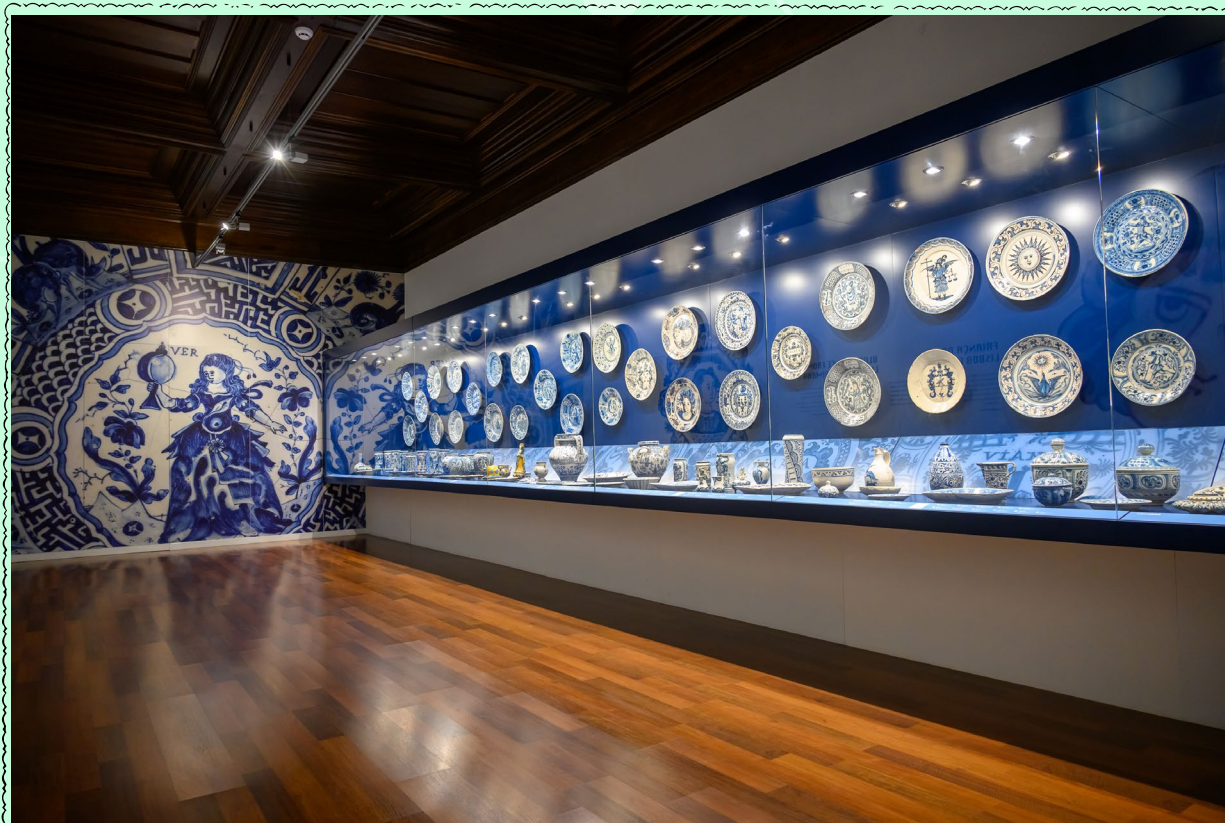
Américo Dias - CMVC

. 11h00 III Encontro de Colecionadores de Faianças Portuguesas . * Visita à coleção cerâmica em reserva