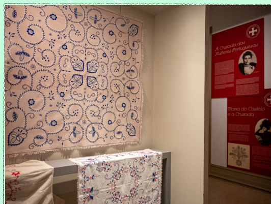
Américo Dias - CMVC