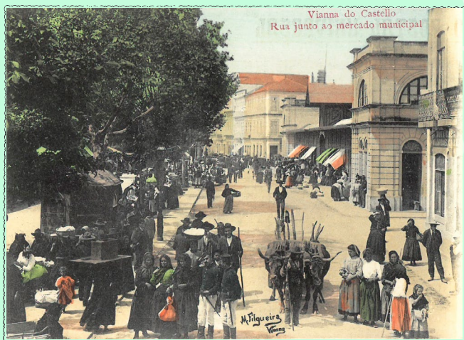
Coleção de Postais. Postal n.º 495 Arquivo e Memória . CMVC

Visita aberta à intervenção arqueológica prévia à construção do novo mercado de Viana do Castelo