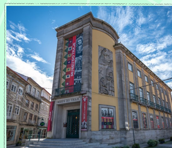
Américo Dias . CMVC

. 10h30 Roteiro do azulejo na etnografia . *