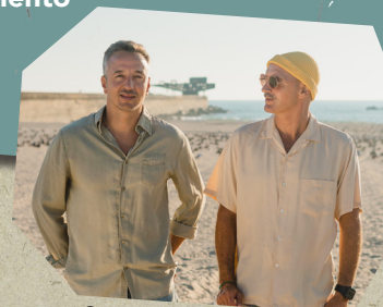
Souls of Fire